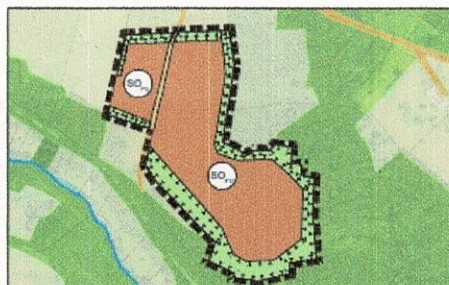
Fortschreibung Landschaftsplan durch Deckblatt Nr. 18